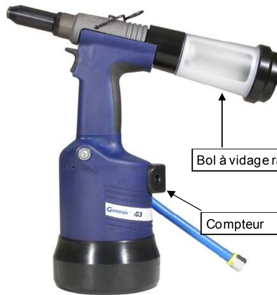
Bol à vidage rapide 1/4 de tour