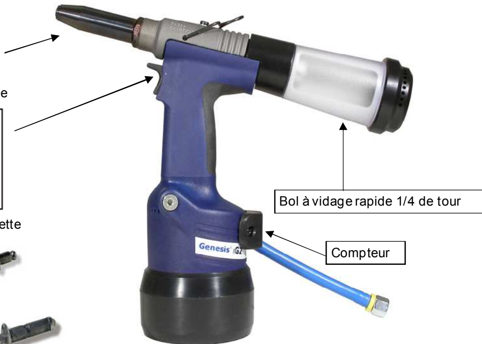
Bol à vidage rapide 1/4 de tour